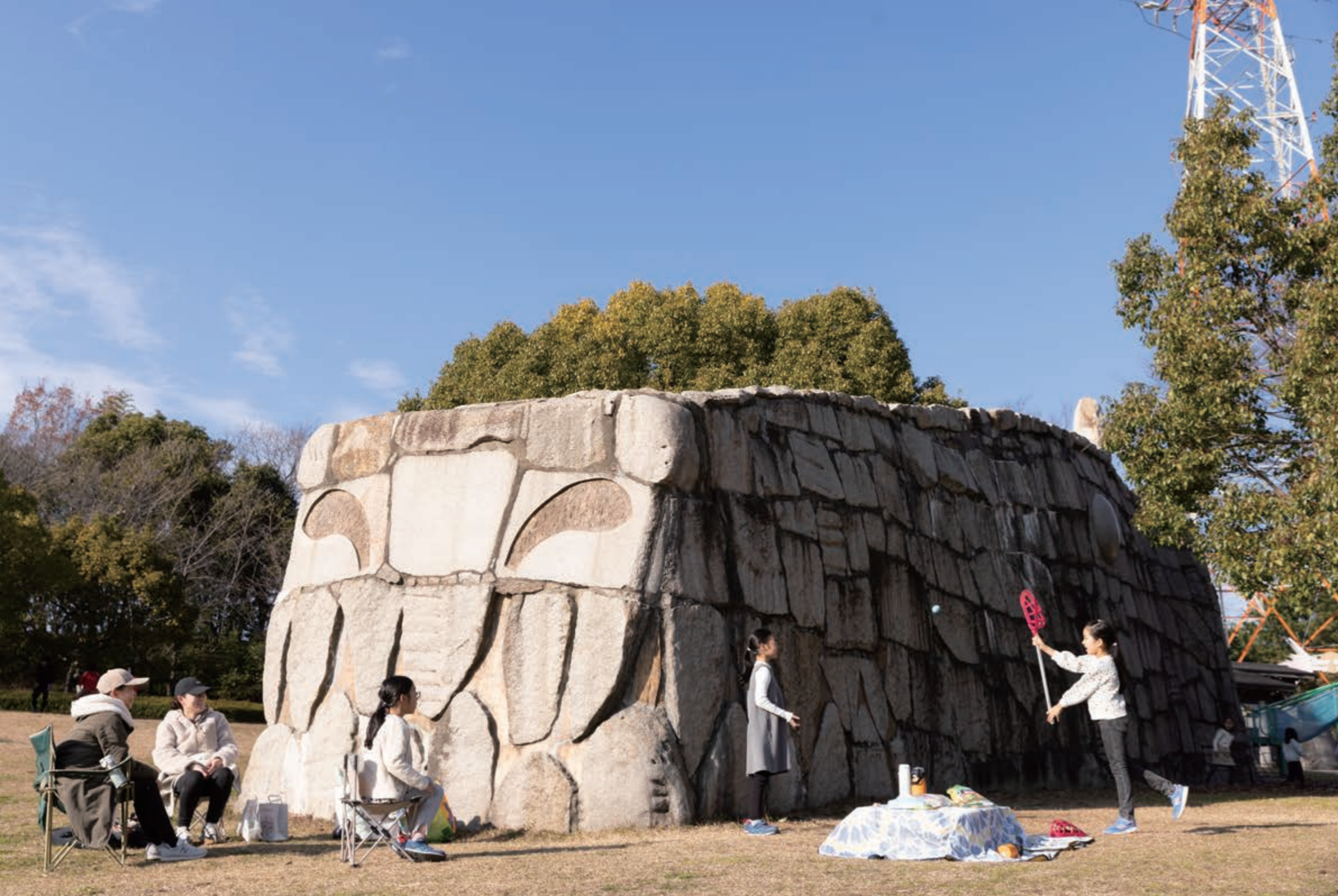
▲今月のおおぶスタイル 2024年の干支は、辰です。大府みどり公園には、ストーンドラゴンという遊具があります。干支にまつわるパワースポットですね。