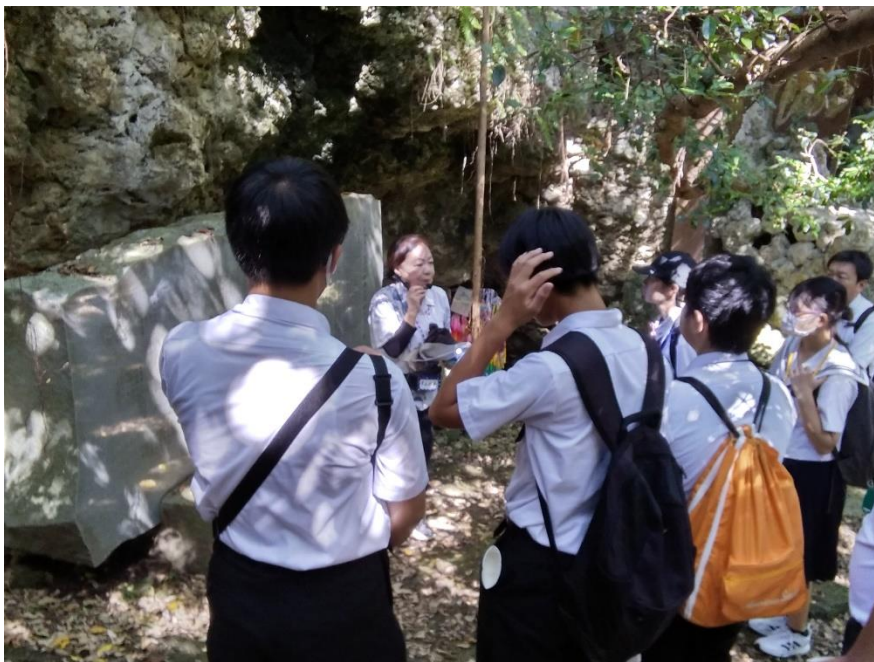
ガマの前でガイドから説明を受ける平和大使（チビチリガマ）

ています。しかし、世界では争いが起こり、関係のない市民が巻き込まれ、命を落としています。ひめゆり平和祈念資料館で聞いた、「戦争は一瞬で始まるが、すぐには終わらない。」という言葉がとでも心に残りました。全ての人にそれぞれの生活があるのに戦争で全てが変わってしまう、奪われてしまうからです。日本だけでなく、世界でこんなことが絶対に起きてはいけないということを伝えていきたいです。今回知った戦争の記憶を、絶対に風化させず、核がない、戦争がないことが当たり前の世界を目指し、語り継がねばいけないと思います。