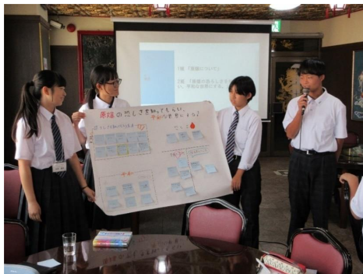
長崎SDGs平和ワークショップで発表する平和大使