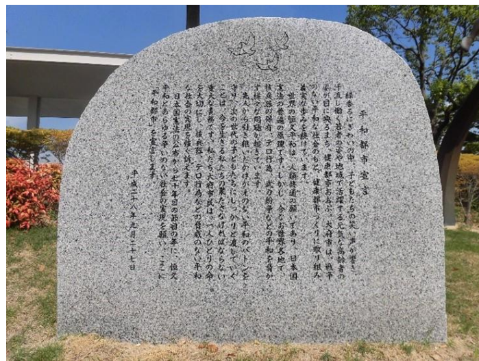
「平和都市宣言」石碑（平成29年9月1日設置）