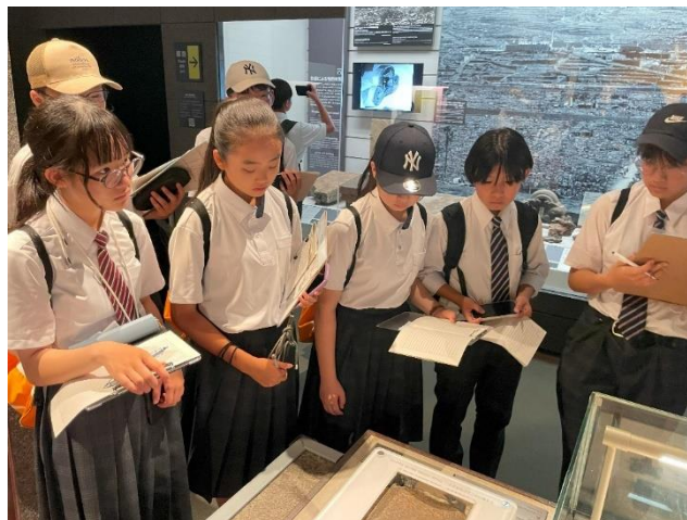
平和案内人の説明のもと、戦争遺品を見学する平和大使（長崎原爆資料館）

今この瞬間にも世界のどこかで戦争が行われています。その現実を絶対に忘れることなく、自分の言葉に責任を持って、今回の派遣で感じたこと、学んだことを、心を込めて伝えていき、平和のバトンを繋げていきます。