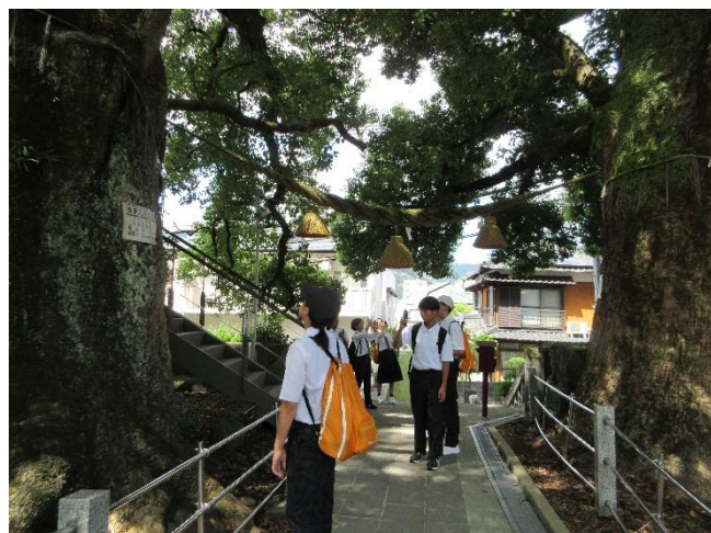
被爆クスノキを見学する 平和大使（山王神社）