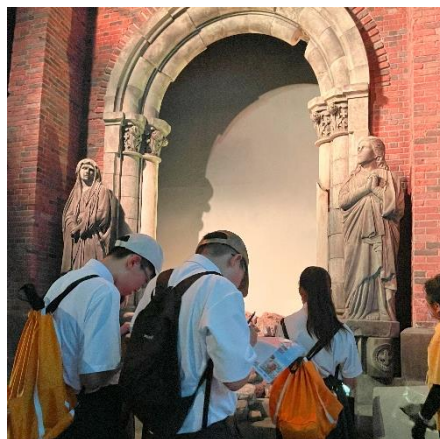
原爆の遺構を見学する平和大使（長崎原爆資料館）