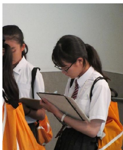
説明を受ける平和大使（長崎原爆資料館）