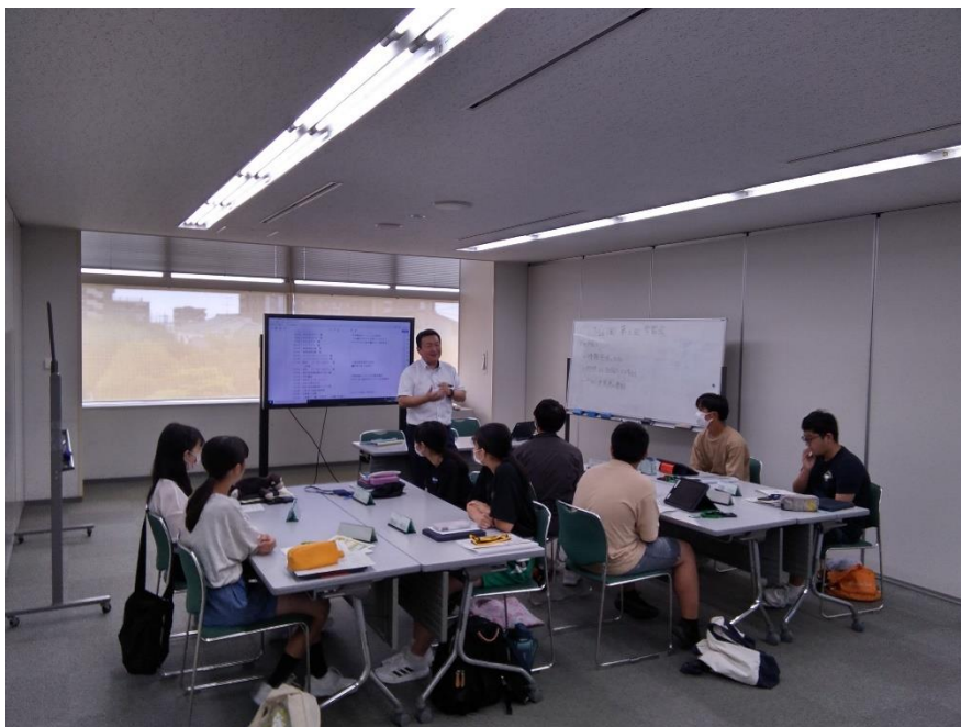
沖縄派遣事前勉強会の様子

世界の人々が向かい合い、話し合っ、笑顔あふれる日常を送れる未来に向けて、平和の心を伝え、つないでいきたいです。