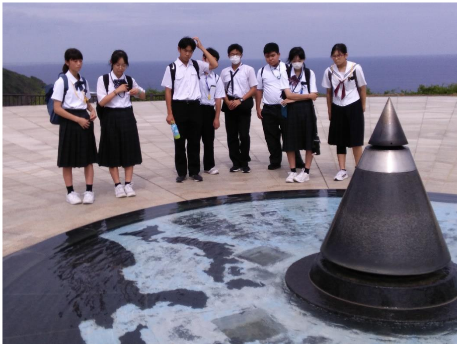
「平和の火」を見学する平和大使（沖縄県平和祈念公園）

全国にはたくさんの戦争に関する資料館や遺跡などがあります。実際訪れて当時のことを知ることが平和の尊さを知る一番の方法ではないでしょうか。修学旅行や学校の授業で訪れる機会がもっと増えればいいなと思いました。また、今回の沖縄滞在中にはSNSでも現地の様子を発信しました。SNSでの発信も、多くの人々に届けることができる方法の一つです。少しでも多くの人に平和の大切さが届くように伝えていきたいと思います。生き残ったことには意味があると立ち上がってくれた人たちに、役割を果たしましたと自信を持って言えるように。