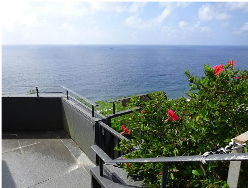
沖縄の美しい穏やかな海

今回学んだ、沖縄の言葉です。戦争を昔話として風化させないた めに、この言葉の意味をずっと呼びかけ続けていきたいです。