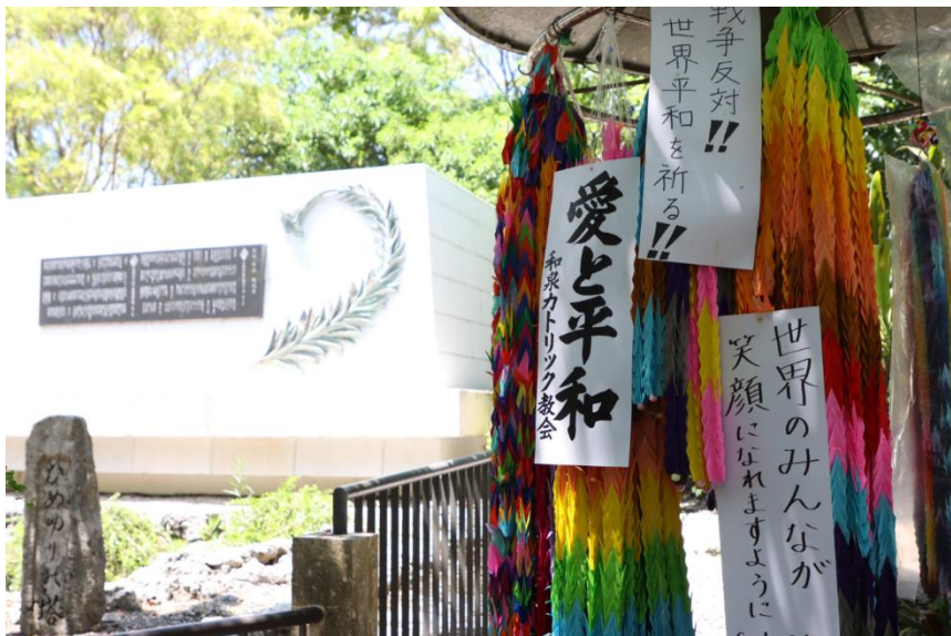
ひめゆりの塔と平和を願う千羽鶴（ひめゆり平和祈念資料館）

派遣中印象に残っていることの1つに、訪れたところの多くに千羽鶴が飾ってあったことです。この折り鶴1つ1つに人々の平和への願いが込められていると思いました。平和を願わない人はいません。平和はみんなの願いです。世界には戦いをしている国があり、日本にも基地問題など未解決な課題があります。私たちにできることは、これらを自分たちの問題として関心を持ち考えること、戦争は絶対にしないと思いつけること、悲惨な戦争の事実や平和への願いを伝え続けることだと思いました。日常的には相手を思いやること、相手を尊重すること、その先に人の輪、平和があると思うので、これらを繋ぎ、守っていきたいと思います。