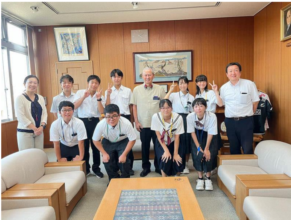
派遣で訪れた読谷村の村長と記念撮影をする平和大使