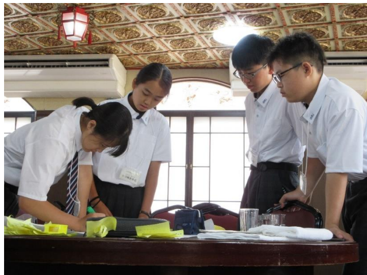
長崎SDGs平和ワークショップで意見を出し合う平和大使

今回の長崎派遣を通して、戦争は二度と起こしては行けないものだと思います。友だちや家族に原爆の実相や平和の大切さについて伝え、インターネットを通じた発信も使って、たくさんの人に伝えていきたいと思いました。もう二度と、戦争を起こしてはいけないことを、何回でも繰り返し伝えていきたいです。