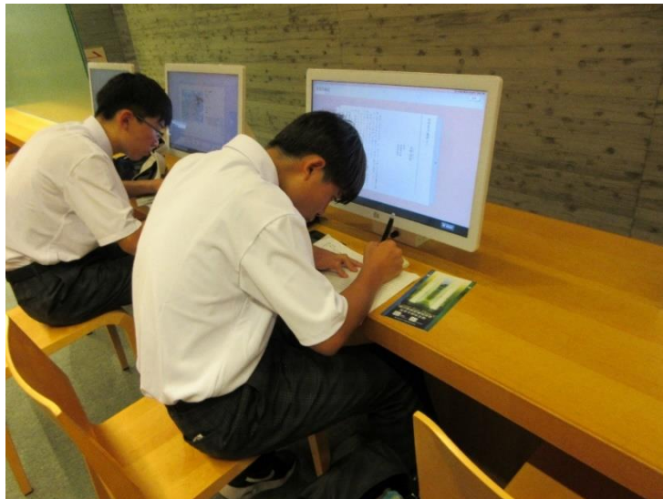
原爆に関する資料を閲覧する平和大使（長崎原爆死没者追悼平和祈念館）

この派遣は自分にとって、世界をよりよく、平和にするための第一歩となりました。一緒に学んだ平和大使のみんなとともに、「平和のリレー」をつなぎ続けていきたいです。