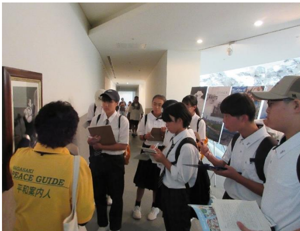
平和案内人から写真の説明を受ける平和大使（長崎原爆資料館）

私は、この派遣を通じて、このような戦争をもう二度と起こしてはならないということを改めて感じました。そのために私は、学んだことを友だちや学校の人、先生や家族などに伝え、発信していきます。小さな一歩でも踏み出して、みんなが知って考えることで、少しでも世界が平和になればと願いを込めて。