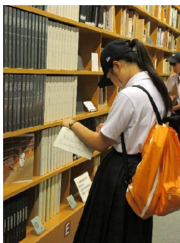
原爆に関する資料を閲覧する平和大使（長崎原爆死没者追悼平和祈念館）