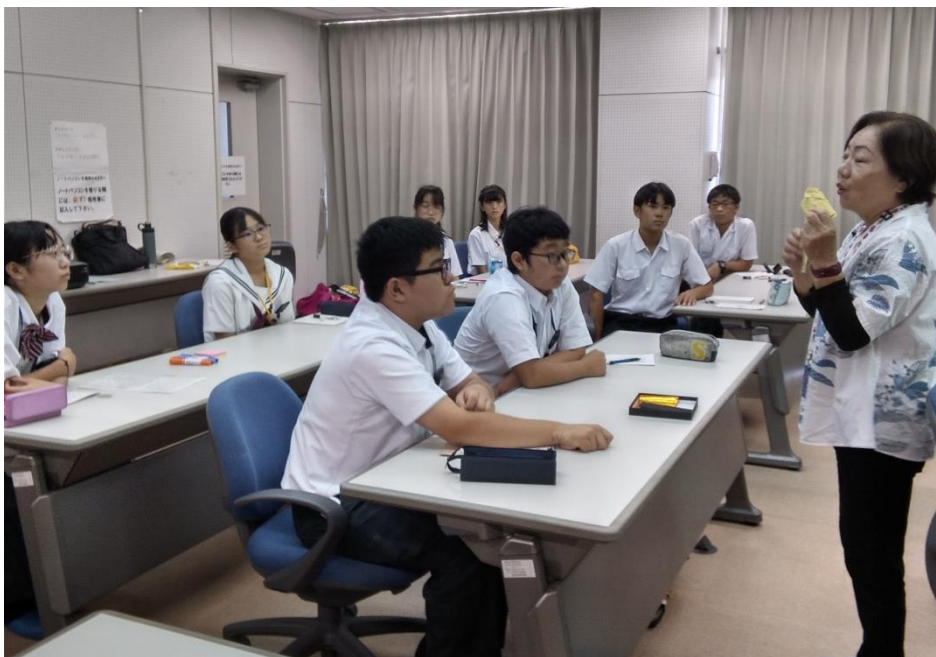
平和講話を聞く平和大使（読谷村地域振興センター）

戦争で一番忘れてはいけないことは、多くの人が亡くなったこと、そして、そんな悲惨で残酷な戦争を起こしたのが、私たちと同じ人間だということです。今、私ができることは、恐ろしい戦争が起きた事実を多くの人に伝えること、相手を思いやり、自分の意見を隠さずに伝えること、戦争がない平和な時代を噛みしめて、大切に生きることだと、改めて思いました。