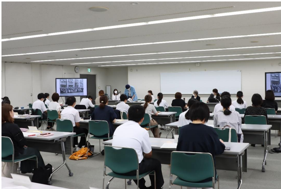
大府市遺族会員及び愛友会大府支部員による戦争体験講話の様子

この3日間、「平和」とは何かを考えました。僕はこの沖縄戦の記憶を忘れさせないため、これからも「平和とは何か」を考え続けていきたいです。そして、沖縄で実際に起きたこと、戦争の悲惨さを通して、平和の大切さをしっかり語り継いでいきます。