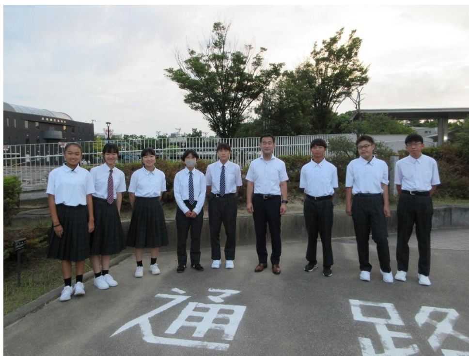
出発前、松山教育長と記念撮影をする平和大使（大府市役所）