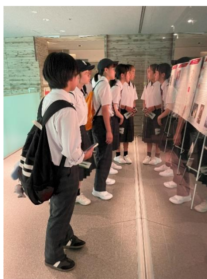
展示パネルを読む平和大使（長崎原爆死没者追悼平和祈念館）