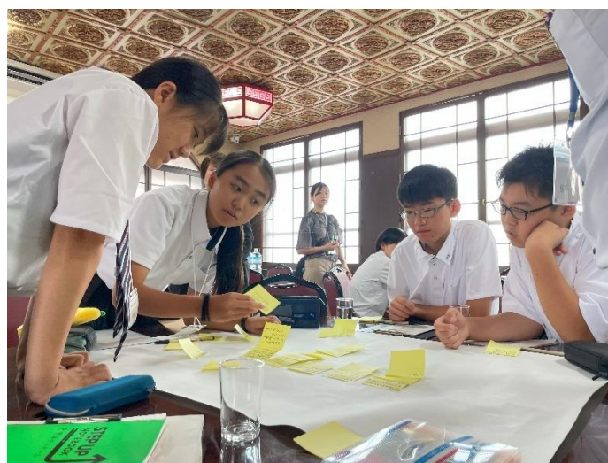
長崎SDGs平和ワークショップで意見交換をする平和大使