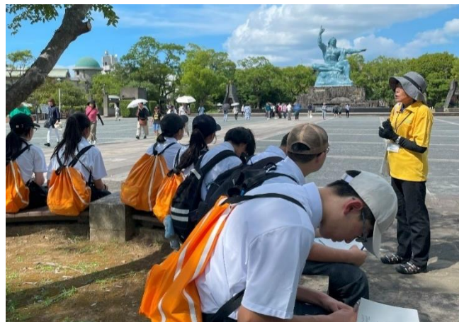
平和案内人の説明を聞く平和大使（平和公園）

「戦争は二度と起こさない！繰り返してはいけない！」ということを、まずは身近な家族や友だちに強く訴えていきたいです。平和について考えるのは難しいことだけれど、今の自分たちがあるのは、戦争や原爆を経験した人たちの努力があってこそということを忘れず、自分も平和を作っていく一員として、向き合っていきたいと思っています。