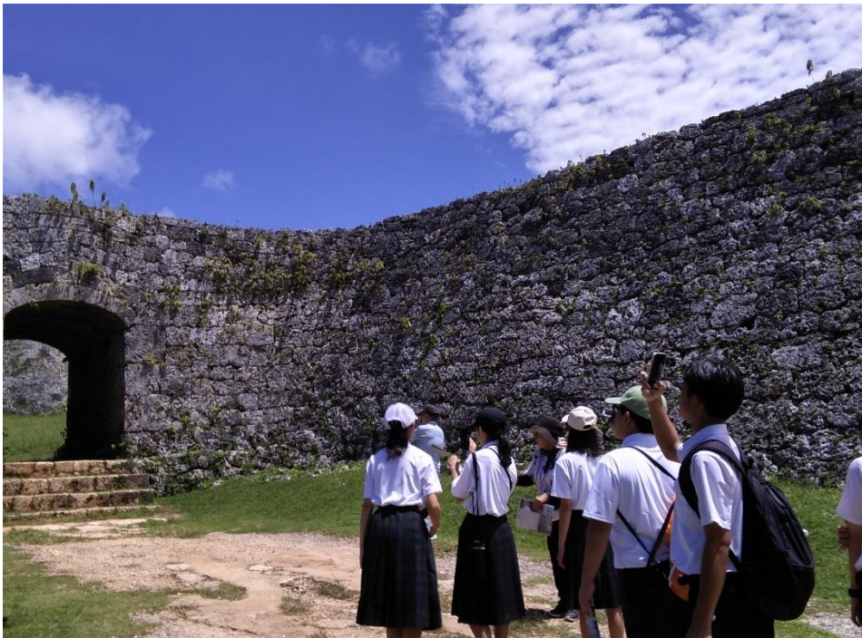
座喜味城跡を見学する平和大使

私は、「平和大使」として、沖縄に行き、沖縄戦のことや戦時中に避難していた場所を詳しく学びました。戦後79年が経ち、戦争を体験した方々もだんだんと少なくなっています。戦争を二度と起こさないためにはどうしたら良いのか、なぜ戦争が起こるのかななどをクラスメイトと話していきたいと思います。また、私たち平和大使が沖縄で学んだことを家族や知り合い、大府市の中学生、また愛知県の人々に伝えていけたらいいなと思います。世界中の人々が笑顔で過ごしていけますように。