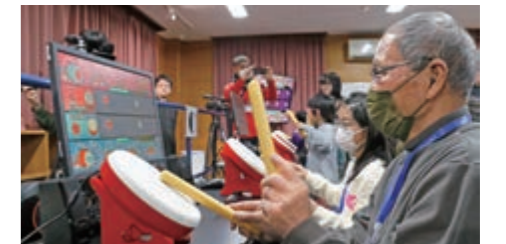
▲多世代で楽しめるeスポーツ

Point 03 新設 「スポーツ振興室」 生涯スポーツや競技スポーツの推進を通じてスポーツをより身近なものとし、市のさらなる魅力づくりにつなげるため、「スポーツ振興室」を新設します。