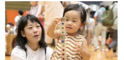
▲木のおもちゃを集めた「木育キャラバンinおおぶ」

Point 01 新設 「健康未来拠点整備室」 おおぶおもちゃ美術館(仮称)や健康増進・交流拠点(仮称)の整備を着実に推進するため、「健康未来拠点整備室」を新設します。