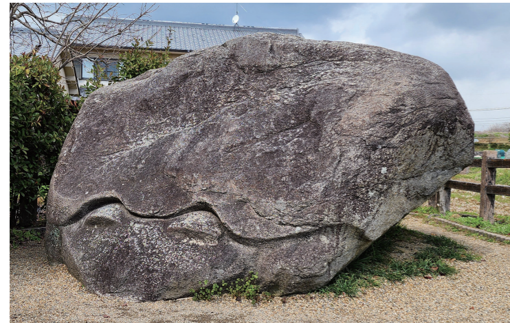
▲亀石(奈良県明日香村)

最近、こどもを連れて奈良県明日香村の遺跡を自転車で巡りました。鬼の狙・鬼の雪隠・亀石など、私が何度も訪れた明日香村の古墳や石造物をこどもと一緒に回るのが夢でした。私たちが亀石に近づくと突然、写真を撮り合っていた年配の男性の1人から英語が飛んできました。「It's a stone tortoise. (石の陸亀です)」。こどもと日本語で話していた私が、いきなり知らない人に英語で話し掛けられて、周囲の注目を浴びて、亀石のように固まってしまいました。