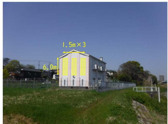
写真②：東側から望む