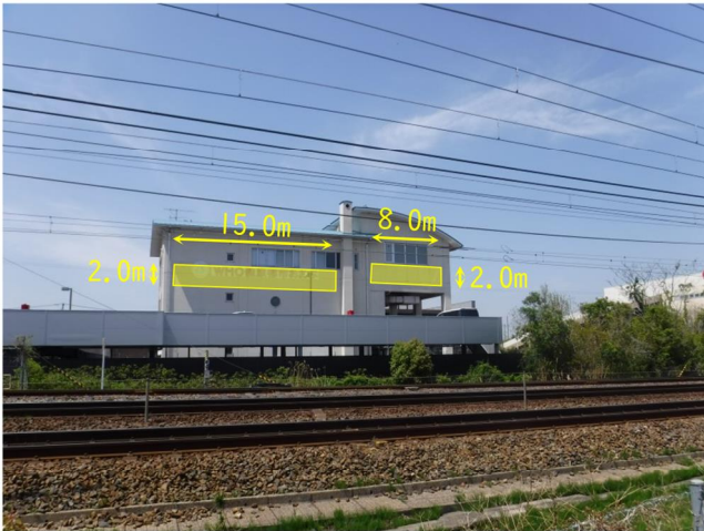
写真①：東側から望む(遠景)