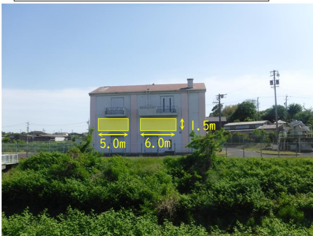
写真①：北側から望む