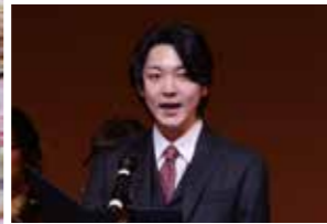
上 岡村市長と実行委員の皆さん 下 決意を語る二十歳代表