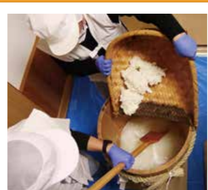
#どぶろく仕込み #2/22(日)はどぶろくまつり