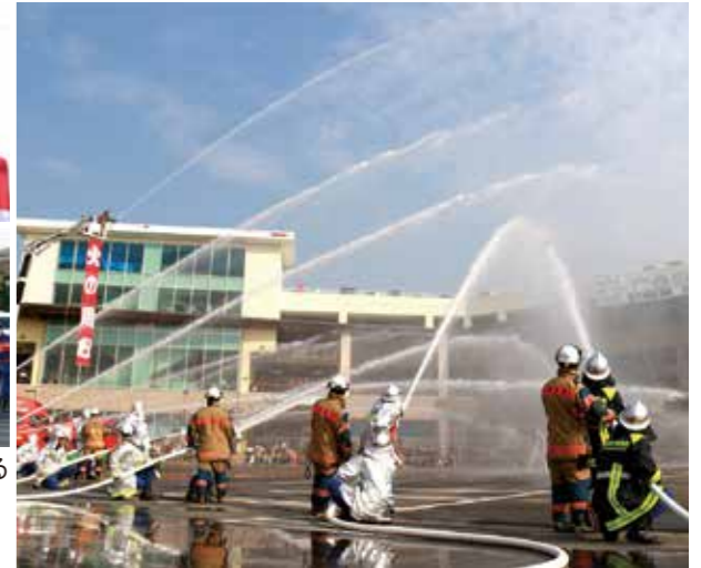
▲消防職員・消防団員・自衛消防隊員による迫力ある一斉放水