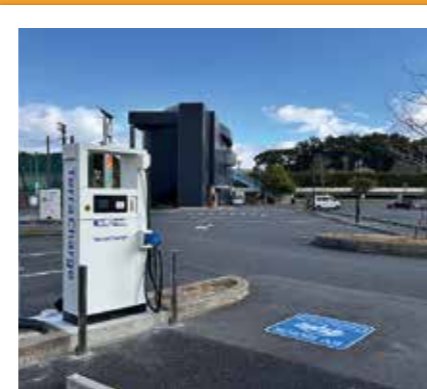
#EV用急速充電器利用開始 #市役所