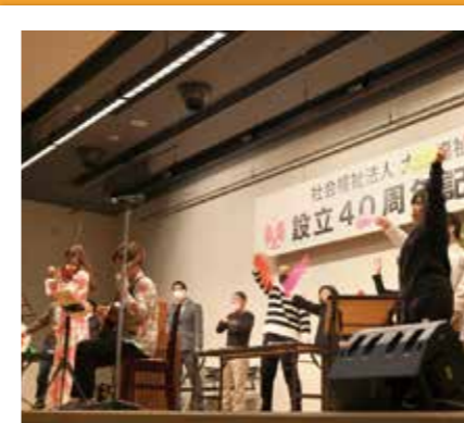
#広報大使 #利用者と奏でるハーモニー