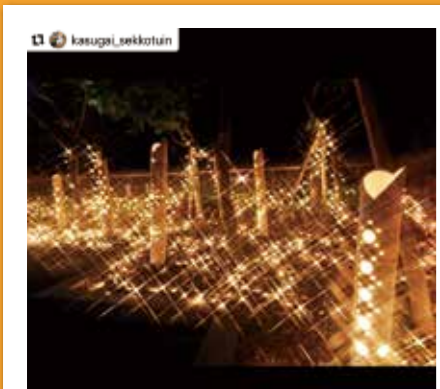
#共和駅 #ゴールドポケットパーク