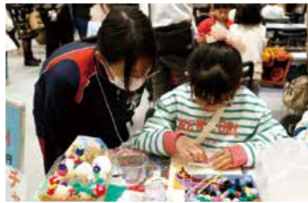
▲アフリカンアクセサリー作りに挑戦中

さまざまな国の文化に触れる国際交流デーが開催されました。国籍・文化の違いを越え、多様な文化と出会い交流の輪を広げるイベントで、インドネシア舞踊などのステージショーやアフリカンアクセサリー作り、ベトナムのライスヌードルシート・ルーマニアのクッキーの試食などのブースが並びました。参加者は「いろいろな国のの人たちと実際に会って話すことができ、とても楽しかった」と笑顔で話しました。