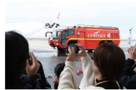
▲放水訓練を撮影する親子

中部国際空港で、知多地域5市5町の親子が空港の仕事学びました。参加者は、不正薬物の密輸入の取り締まりなどを行う税関や、24時間体制で空港の安全を守る空港消防所の職員から話を聞き、普段は入ることのできないエリアで空港の舞台裏に目を輝かせました。