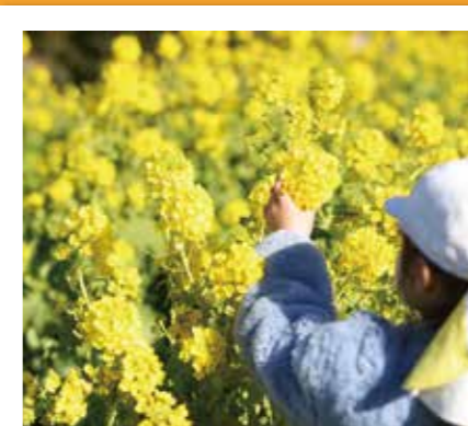
#おおぶ菜の花クラブ #一足早い春の訪れ