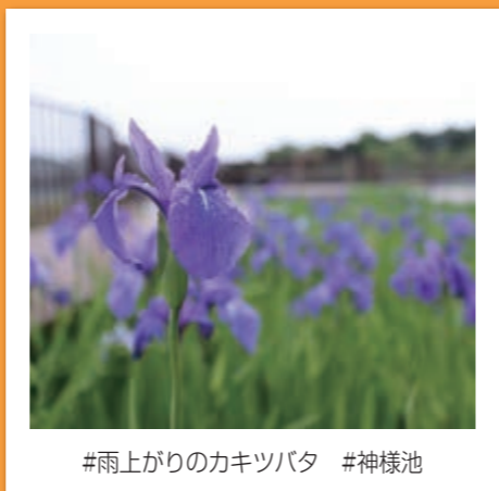
#雨上がりのカキツバタ #神様池