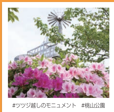
#ツツじ越しのモニュメント #桃山公園

この寄贈により、宿泊利用だけでなく、災害時に公設福祉避難所として活用する際の環境改善も図られました。