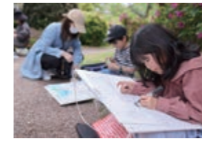
上 第1回から続く、親子の写生大会 下 足場ブランコに乗ってのねらう親子