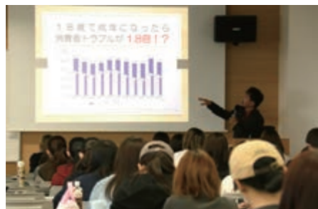
▲説明に聞き入る学生の皆さん

参加者は「成人になり、トラブルに遭う確率が高まったと感じました。契約時に内容をしっかり確認します」と話しました。