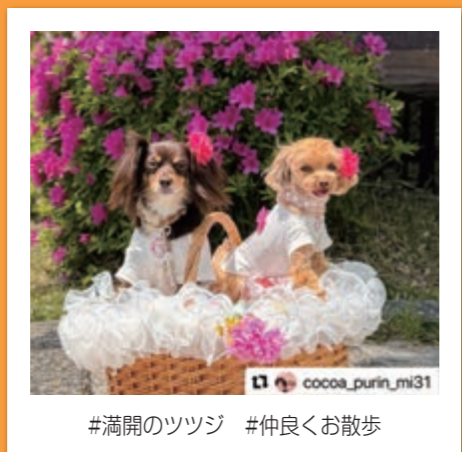
#満開のツツジ #仲良く散歩