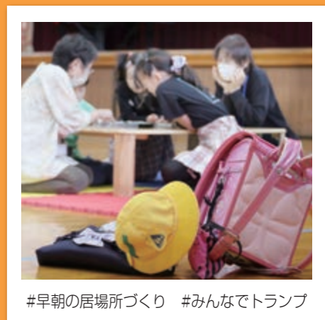
#早朝の居場所づくり #みんなでトランプ

あなたの投稿が広報おおぶで紹介されるかも? ① @obu_city_official をメンション ② 市公式アカウントをタグ付け