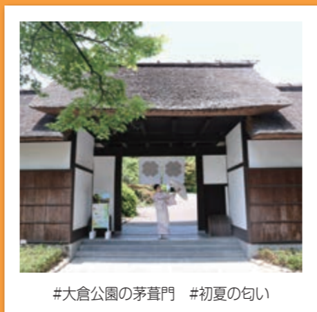
#大倉公園の茅葺門 #初夏の匂い