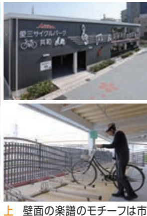
上 壁面の楽譜のモチーフは市公式イメージ曲「HABATAKI」 下 24時間入出庫可能な無料駐輪場