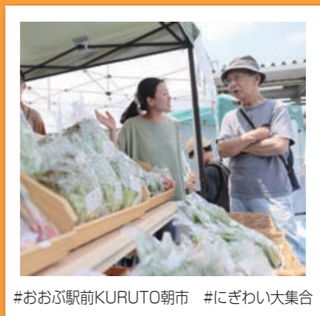
#おおぶ駅前KURUTO朝市 #にぎわい大集合