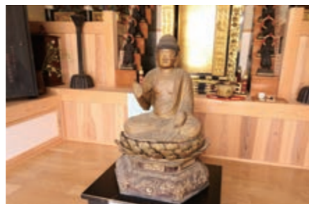
▲市指定文化財「木造阿弥陀如来坐像」

誕生仏に甘茶をかけて、市内24の寺院をめぐる祝う花まつり巡拝。訪れた親子は、「地域の伝統行事を体験できました」と笑顔で話しました。