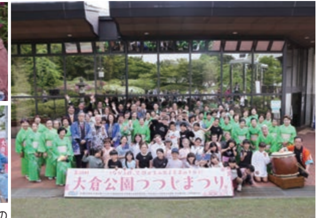
▲セントキルダ小学校の訪問団もまつりに参加