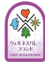
ブランドロゴマーク