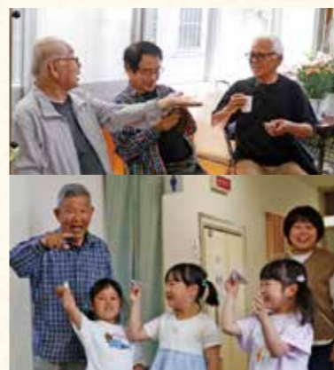
サロンの紹介ポスターを見て、友達同士で来てみました!

季節の新鮮な食材と国産の調味料にこだわった、彩り豊かな食事が運ばれると「おいしそう!」という声があちこちから聞こえます。保育士の経験のあるスタッフが多く在籍し、温かい声掛けとともに栄養バランスに配慮した食事が提供される、居心地の良いサロン。食後には、バイオリンの伴奏に合わせてスタッフと歌を楽しむレクリエーション。スタッフの元気な歌声に誘われて、参加者も笑顔で声を合わせていました。