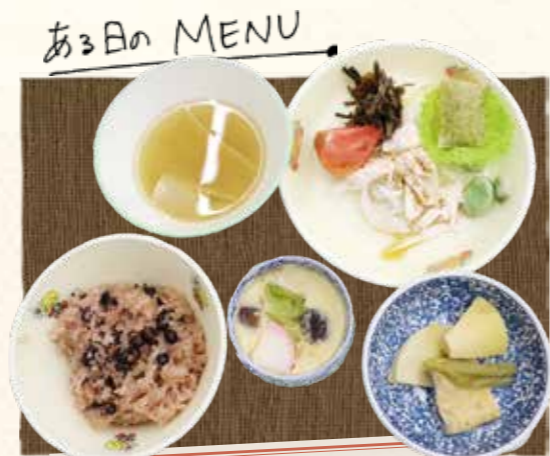
赤飯・コシアブラの天ぷら タケノコの煮物・ワラビのお浸し 茶碗蒸し・サラダ・みそ汁・デザート