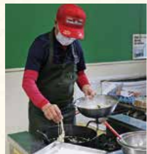
三世代で来ています。まごころいっぱいのお昼ご飯に、まちの人たちが声を掛け合う温もりのある場所です。