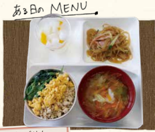
鶏そぼろごはん 春雨のサラダ 野菜たっぷりスープ フルーツゼリー