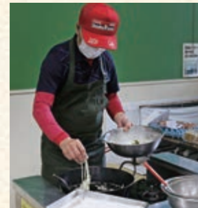
三世代で来ています。まごころいっぱいのお昼ご飯に、まちの人たちが声を掛け合う温もりのある場所です。