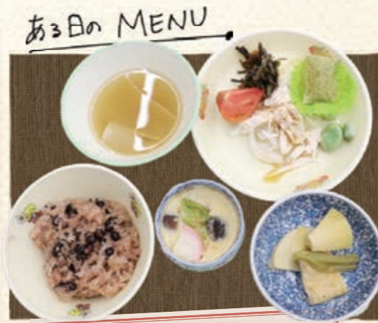
赤飯・コシアブラの天ぷら タケノコの煮物・ワラビのお浸し 茶碗蒸し・サラダ・みそ汁・デザート