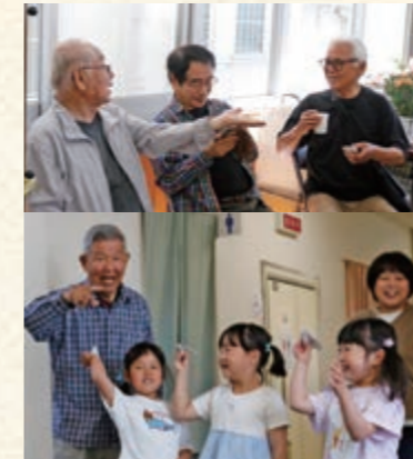
サロンの紹介ポスターを見て、友達同士で来てみました！

季節の新鮮な食材と国産の調味料にこだわった、彩り豊かな食事が運ばれると「おいしそう！」という声があちこちから聞こえます。保育士の経験のあるスタッフが多く在籍し、温かい声掛けとともに栄養バランスに配慮した食事が提供される、居心地の良いサロン。食後には、バイオリンの伴奏に合わせてスタッフと歌を楽しむレクリエーション。スタッフの元気な歌声に誘われて、参加者も笑顔で声を合わせていました。