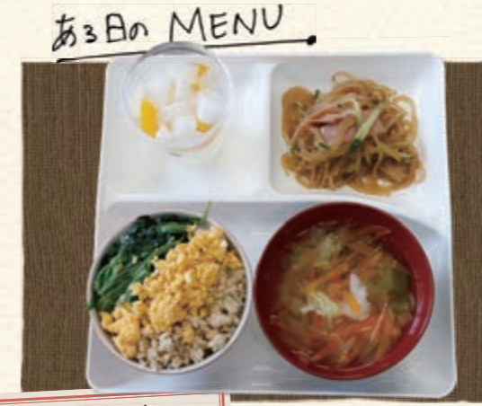
鶏そぼろごはん 春雨のサラダ 野菜たっぷりスープ フルーツゼリー