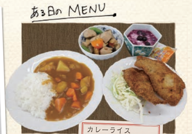
カレーライス 筑前煮 カツ・ゆでキャベツ フルーツヨーグルト